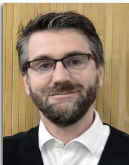
Me Xavier Anonin.

Le 22 février 2025 était publié au Journal officiel le nouveau modèle de devis prévu à l'art. L. 2223-21-1 du CGCT modifiant le modèle institué par l'arrêté du 23 août 2010. Outre une présentation formelle imposée, présentée sous la forme d'un tableau et quelques mentions obligatoires, le nouvel arrêté se distingue de l'ancien par la présence de nombreux commentaires, constituant le socle fondamental des informations à communiquer aux familles et qui devront, a minima, figurer dans les conditions générales des opérateurs funéraires. Il entrera en vigueur le 1 er juillet 2025.