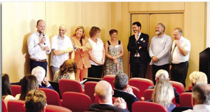
Les référents régionaux lors de l'assemblée générale de la Fédération en 2023.

Chaque région dispose d'un référent FNF, un professionnel du funéraire qui